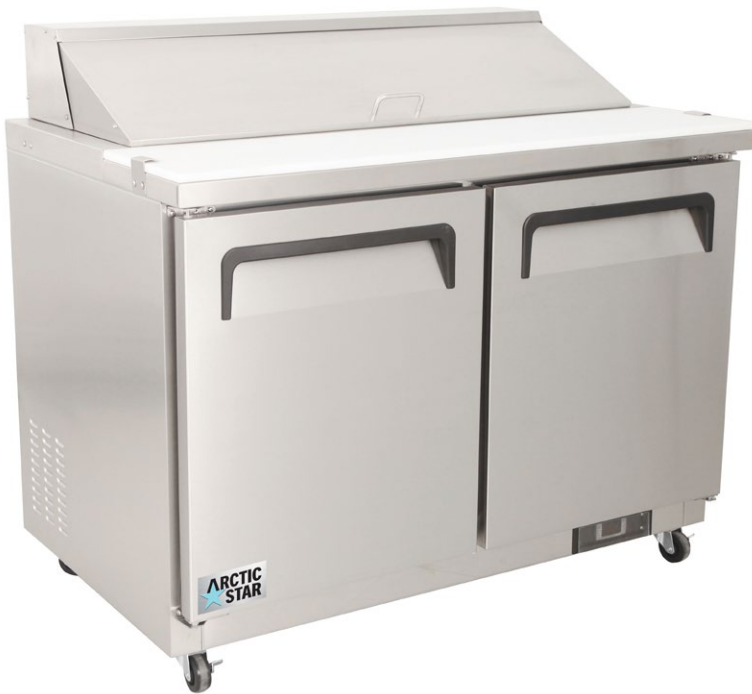
TABLE DE PRÉPARATION SALADE ET SANDWICH