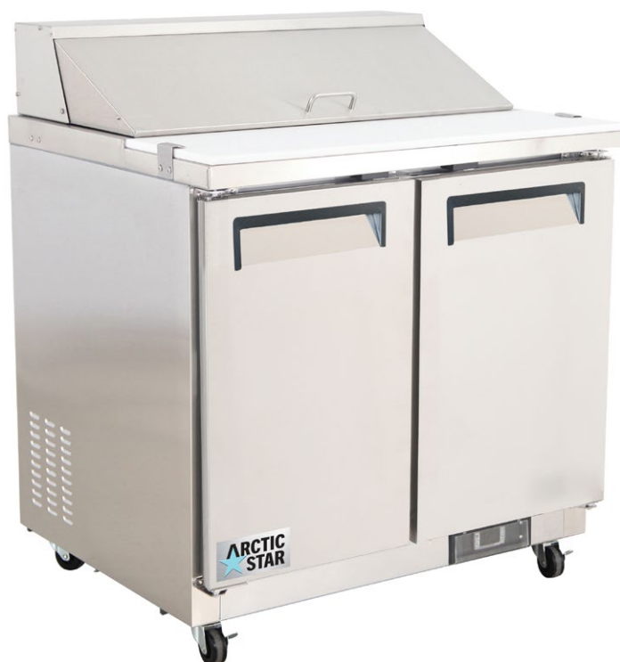
TABLE DE PRÉPARATION SALADE ET SANDWICH