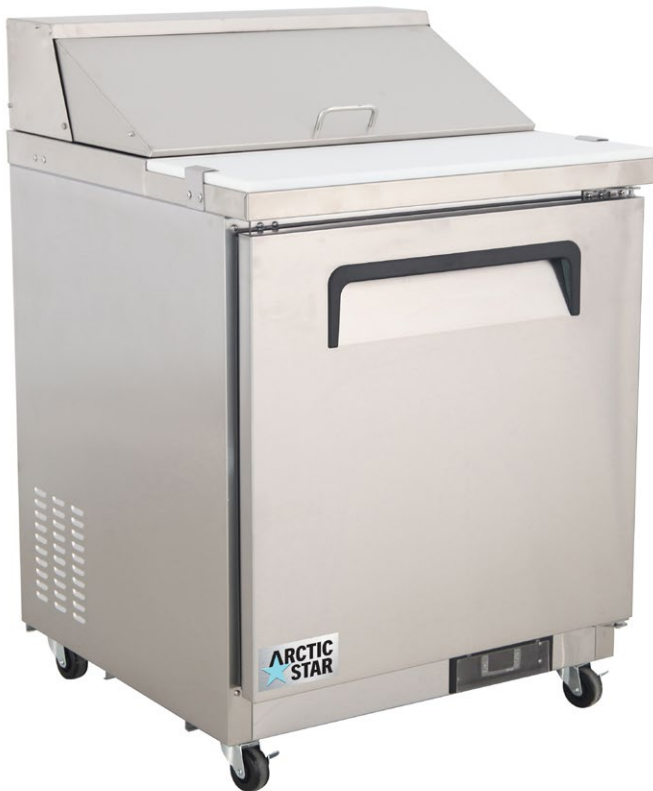
TABLE DE PRÉPARATION SALADE ET SANDWICH