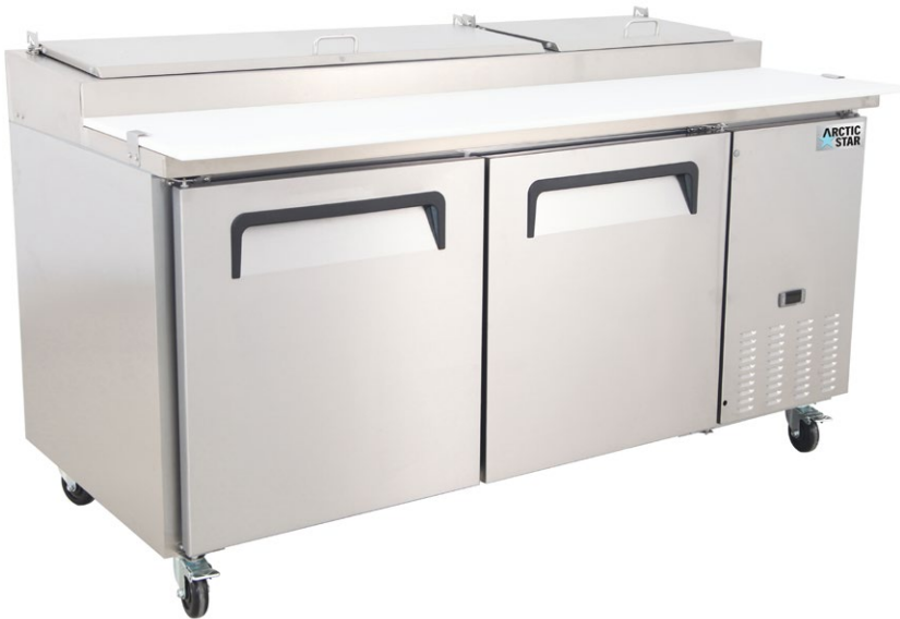
TABLE DE PRÉPARATION PIZZA