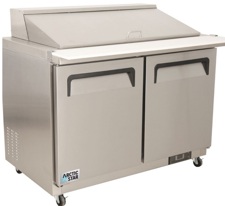
TABLE DE PRÉPARATION SALADE ET SANDWICH MEGATOP