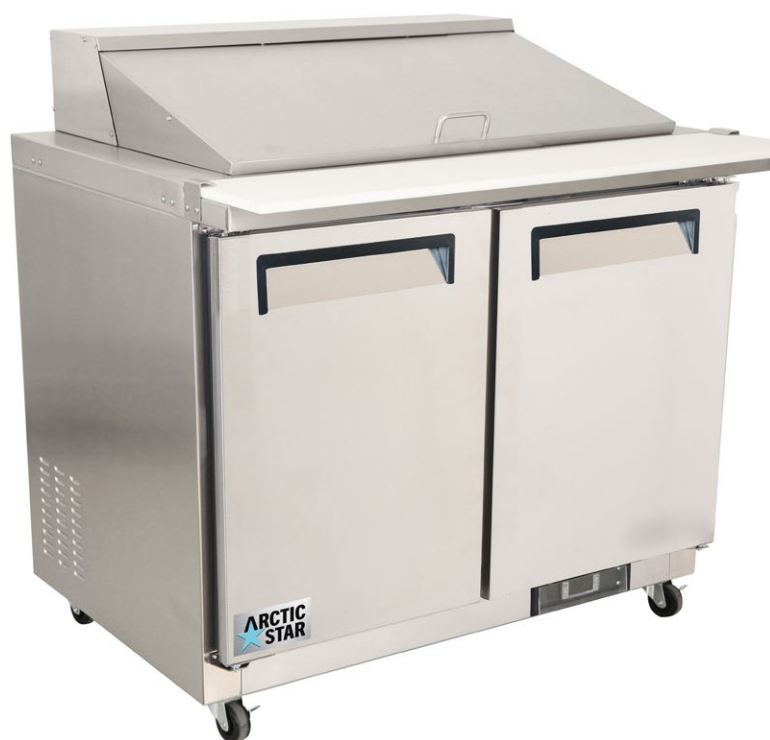
TABLE DE PRÉPARATION SALADE ET SANDWICH MEGATOP